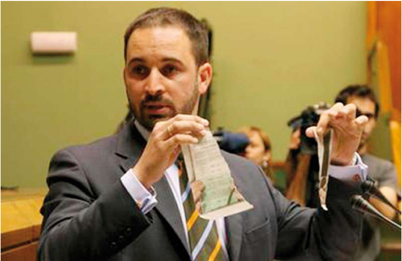
Santiago Abascal Conde, parlamentario del Partido Popular rompe la papeleta del Referéndum de Ibarretxe durante el Pleno de la Cámara Vasca.

la que podría denominarse pragmática o autonomista. El lehendakari se ha empeinado con su plan secesionista y le puede salir muy mal, tanto en términos de confrontación con el Estado como en provocar un clima social que se vuelva contra él y contra su partido en las próximas elecciones autonómicas. Quedan pocos meses para salir de dudas.