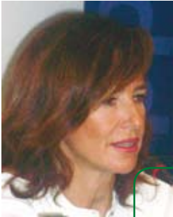
Teresa Jiménez Becerril

Sabíamos ya que España, como dice el título de la película con la que Bardem ha ganado un Oscar, no es país para viejos, sobre todo desde que Zapatero llegó al poder. Lo que no sabíamos es que tampoco lo era para héroes y María San Gil y José Ortega Lara, lo son. Recuerdo cuando José Antonio me llamó a Italia hará un año para pedirme si podía ir a Burgos a hablar sobre el terrorismo, me conmovió su humildad, su manera de presentarse, ignorando que alguien como él no necesitaba presentación. Mientras él enumeraba quienes participarían, para animarme a unirme a ellos, yo pensé, que nada me importaba el tipo de acto, ni quien hablase en él, que yo iría al fin del mundo a defender la libertad si quien me lo pedía era José Antonio Ortega Lara. Y allí fui, sin dudarle a apoyar a quien ETA tuvo casi dos años en un agujero y consiguió vivir para que los españoles tuviéramos un referente moral. ¿Cómo es posible sobrevivir a un infierno así y seguir luchando por la libertad de los demás, escoltado desde que lo liberaron? Seguramente tiene que ver con los principios, con los valores, con la constancia y sobretodo con la fe. Eso fue lo que yo descubrí en Burgos, conversando con un hombre sonriente, de mirada limpia y clara, tranquilo, sin odio, que creía en los jóvenes, a los que hablaba con naturalidad de su experiencia.